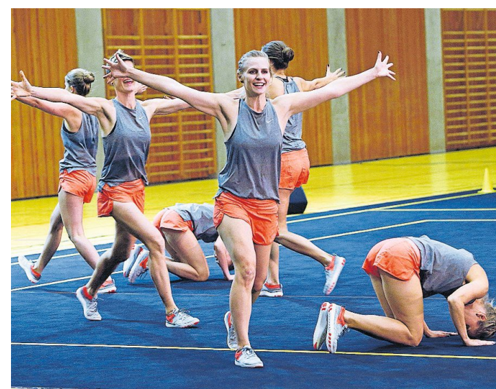
Anmutig und ästhetisch: die Darbietung der Frauen vom TV Boswil.